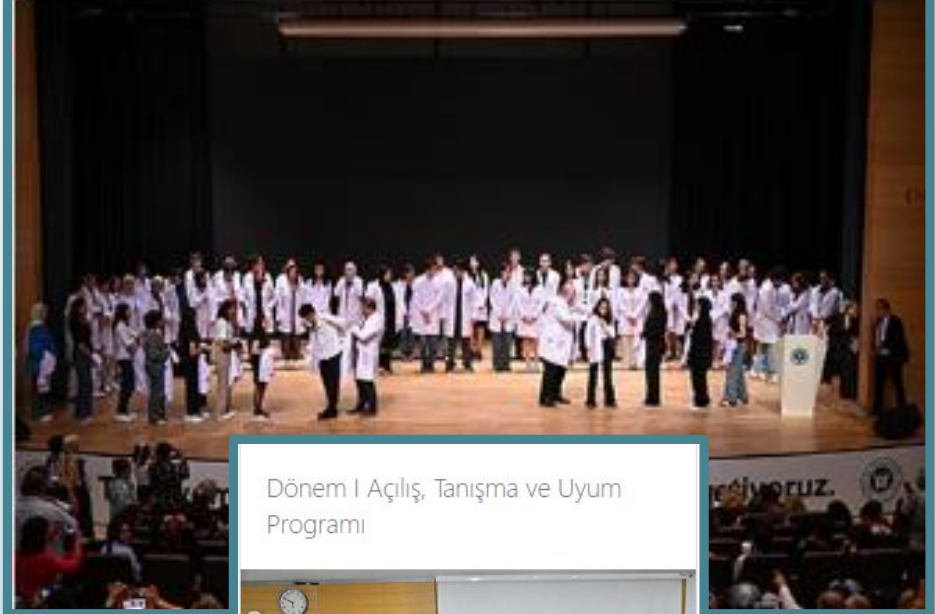
Dönem I Açılış, Tanışma ve Uyum Programı