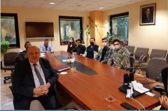
Öğrenci Temsilcileri Dekanlık'ta Toplandı