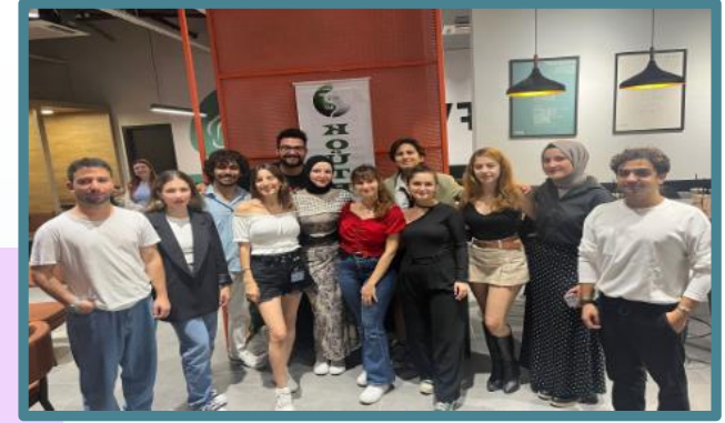
KOÜTBAT & II.ULUKONGRE