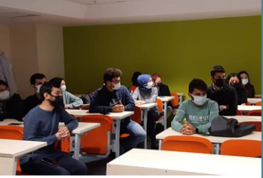
2021-2022 Eğitim yılının başlamasıyla