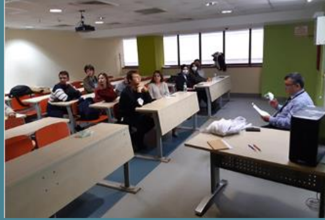
Öğrenci Kulüpleri İle Toplantı