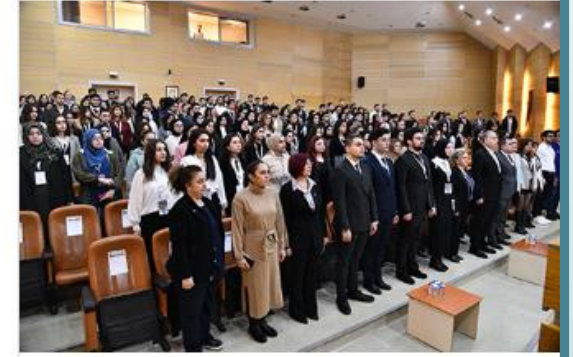
25-26 Kasım tarihlerinde Kocaeli