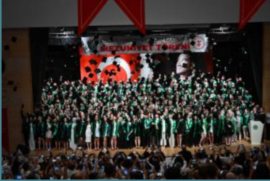
Tıp Fakültesi Mezuniyet Töreni